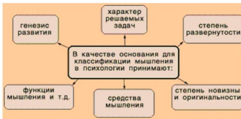
Рис.1. Схема современной классификации видов мышления по различным основаниям: 1) генезис развития; 2) характер решаемых задач; 3) степень развернутости; 4) степени новизны и оригинальности; 5) средства мышления; 6) функции мышления и т.д.

В современной психологии принята и распространена следующая несколько условная классификация видов мышления по таким различным основаниям.